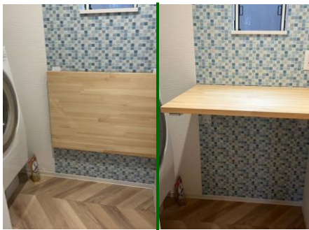
パタフライ（折り畳み）テーブル

さらに空間を美しく保つ工夫が随所に盛り込まれています。キッチンカウンターは両側から取り出し可能なうえ、扉を閉めて収納できます。洗面室には折り畳み出来る壁付けテーブルを取り付けました。洗濯物を畳む、アイロンがけ、衣類の一時置き場として使えて未使用時は折り畳めます。タイル柄クロスや床にも拘りませんでした。限られた空間を有効に活用できる一石二鳥の空間ですね。