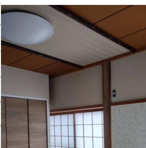
天井の意匠を活かして丸い照明に交換

部屋の一角を塾にしたところのご要望があり、物件探しの段階でその点も考慮しました。「教室の壁は自由に使えるマグネット壁にして生徒さんが楽しめるようにしたい」と英語講師の奥様。玄関に近い和室を一部リフォームしました。マグネット壁クロスは優しい柄を選ばれ、和の趣はそのままなので客間としても使えます。