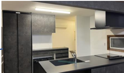
リビングから眺めるキッチン空間

「CENTRO」は海外ブランド機器を導入しており食洗器にドイトの「ミレー」社を採用されました。機器にも拘りぬいておられます。ワークトップの天井にスポット照明のご提案をしました。