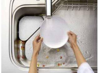
ゴミが作業中に自然に流れる