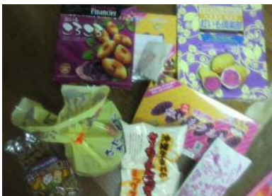
大量の沖縄土産です。甘いものばかり♪