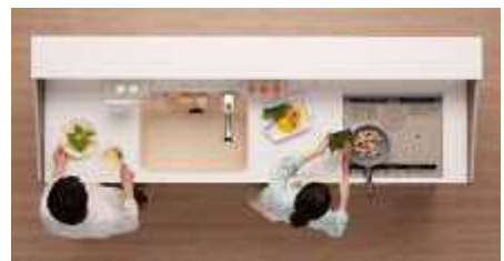
2人同時に並んで使えるキッチンスペース

コンロ上のフードは油汚れを自動洗浄する機能が付いたものや、水垢・キズがつきにくく音も静かなシンクなど多岐にわたり使い勝手のよいものがあります。そして、キッチンを選ぶ際には高さも考慮してください。一般的に使いやすい高さは「身長÷2+5cm」が目安です。また、ガスコンロからIHクッキングヒーターへの入替は火を使わないから安心ですね。 ご相談はお気軽にどうぞ！