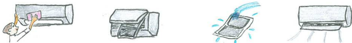
① 固く絞った雑巾で拭く ② フィルターを外しルーバーを拭く ③ フィルターを水洗いし乾かす ④ セットして送風運転する

必ずしっかり乾燥させて水分が残らないように気をつけてください。水分が残っているとエアコンの故障やカビ発生の原因となってしまいます。また、エアコン洗浄スプレーが市販されていますが、スプレーが電装部分に付着し突然作動しなくなるケースがあります。あまりお勧めできません。